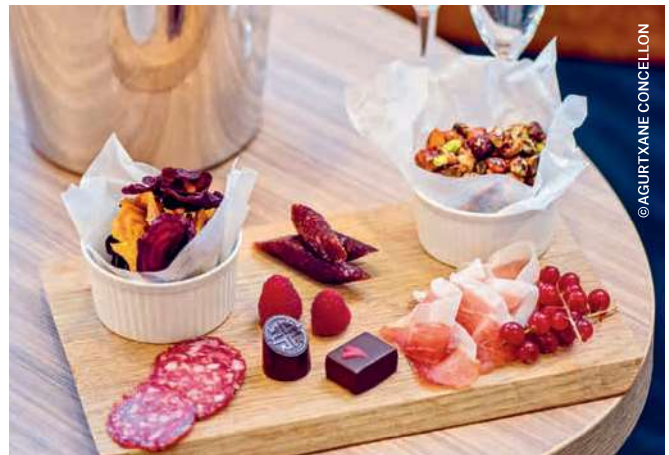
EXPEDITION Suite mit Willkommensgruß