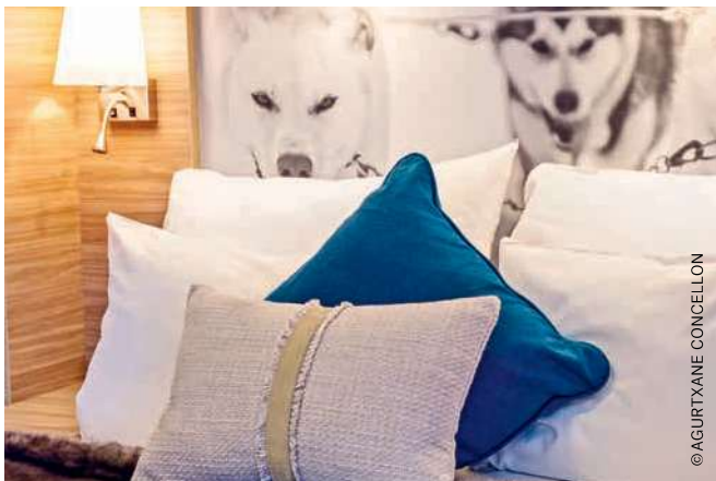
ARKTIS Außenkabine Superior