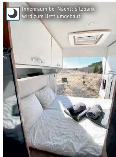
Innenraum bei Nacht: Sitzbank wird zum Bett umgebaut

Kategorie X13 bietet ein festes Bett im Heck und nach kurzem Umbau ein weiteres Bett im vorderen Bereich. Dusche/WC sind vorhanden.