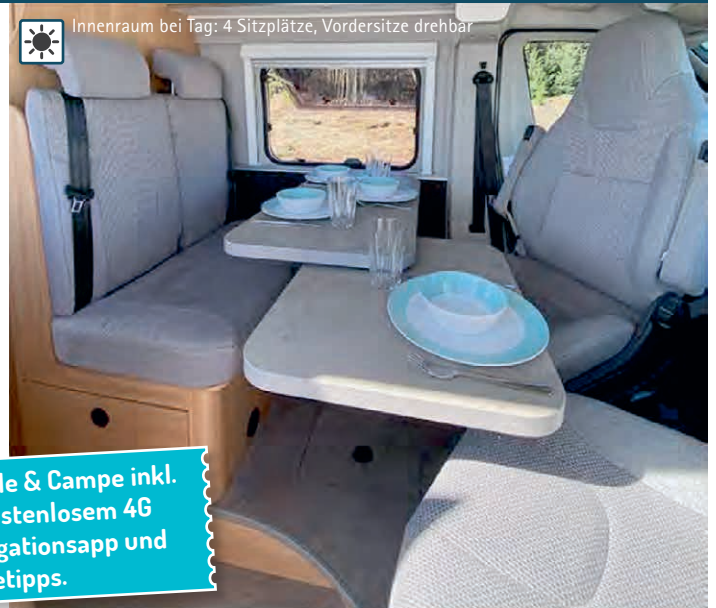
Innenraum bei Tag: 4 Sitzplätze, Vordersitze drehbar

Alle Wohnmobile & Campe inkl. Tablet mit kostenlosem 4G Internet, Navigationsapp und Reisetipps.